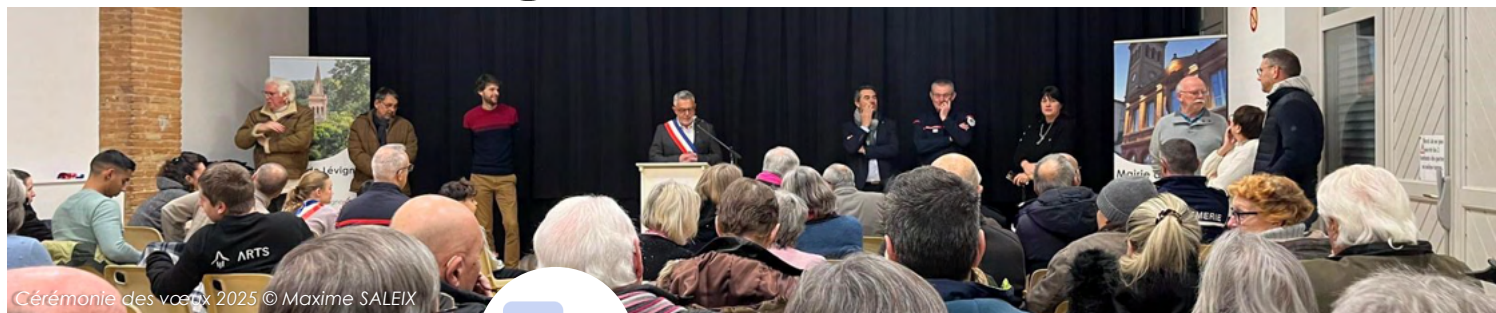
Cérémonie des vœux 2025