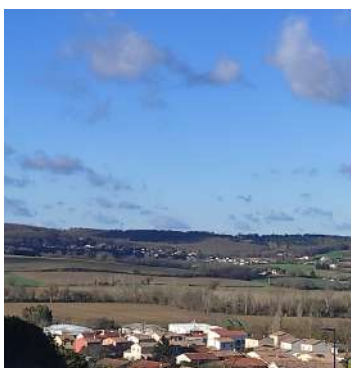
Vue sur Lévignac-sur-Save