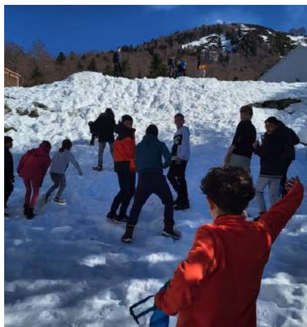
Petits et grands s'amuse dans la neige