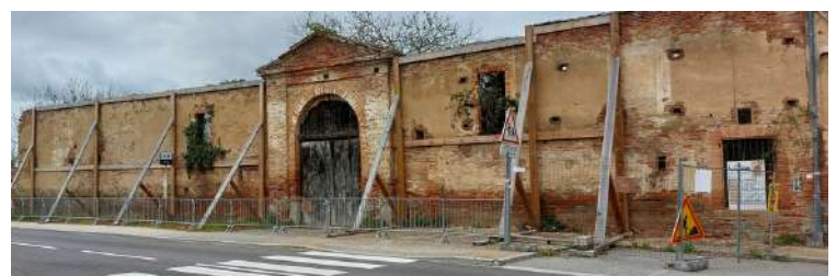
Façade du bâtiment de Ranse

Le projet vous sera présenté lors d'une réunion publique par les porteurs du projet dès lors que les derniers obstacles administratifs auront pu être levés.