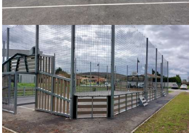
Vues du City Stade