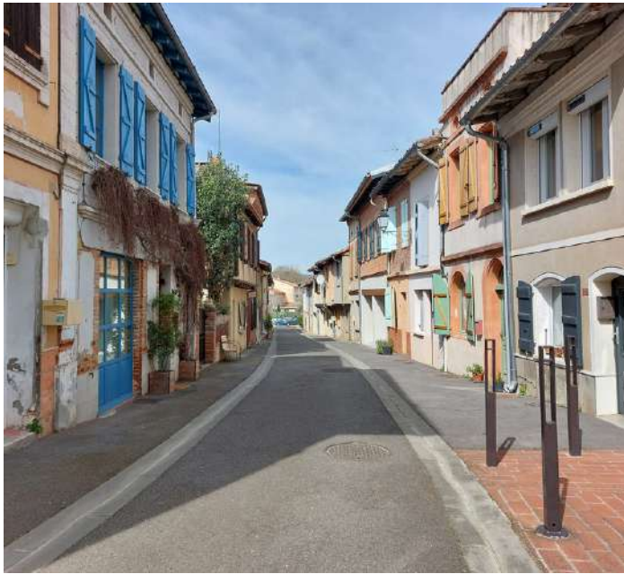
Rue Notre Dame

Bien que l'ouverture de cet espace à aménager soit prévue de longue date dans le PADD (Plan d'aménagement et de développement durable) de notre commune, la récente loi, dite ZAN (Zéro Artificialisation Nette), vient modérer la planification des nouvelles constructions sur les espaces agricoles.