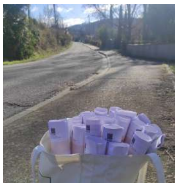
Chemin de Mariette

Un partenariat avec le Centre Social et le CCAS a été mis en place afin d'accompagner la population dans cette démarche. Nous savons que 93 % des logements ont ainsi été recensés comme occupés sur le village.