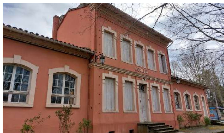
Ancienne école élémentaire

Vous serez prochainement invités à des réunions de concertation pour que vous puissiez vous approprier ce projet qui doit permettre l'émergence du tiers lieu qui fera la part belle à la convivialité, et au vivre ensemble.