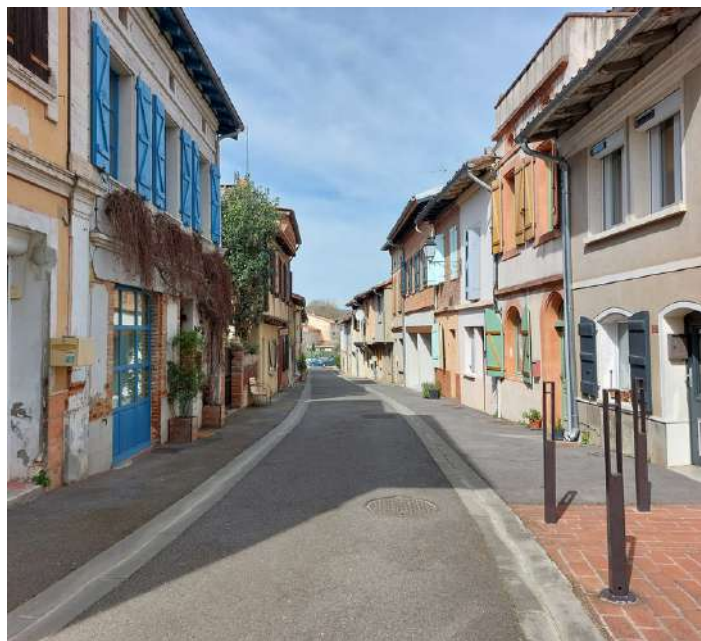
Rue Notre Dame

Bien que l'ouverture de cet espace à aménager soit prévue de longue date dans le PADD (Plan d'aménagement et de développement durable) de notre commune, la récente loi, dite ZAN (Zéro Artificialisation Nette), vient modérer la planification des nouvelles constructions sur les espaces agricoles.