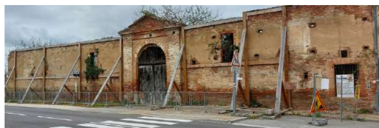
Façade du bâtiment de Ranse

Le projet vous sera présenté lors d'une réunion publique par les porteurs du projet dès lors que les derniers obstacles administratifs auront pu être levés.